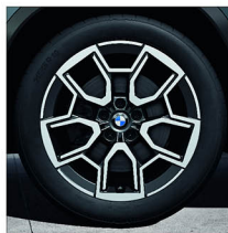
V 輻式 867