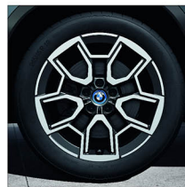
V 輻式 867