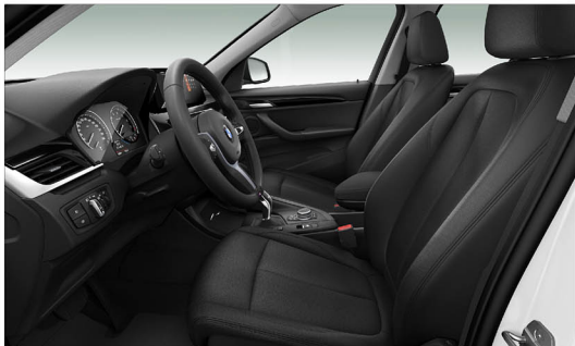
Sensatec皮質 X1 sDrive18i