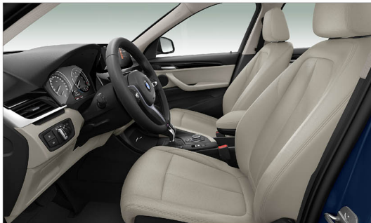
Sensatec皮質 X1 sDrive20i