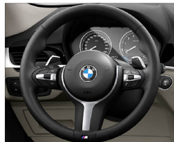
M款多功能真皮方向盤(含換檔撥片)