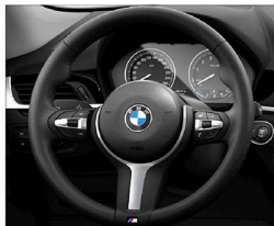
M款多功能真皮方向盤