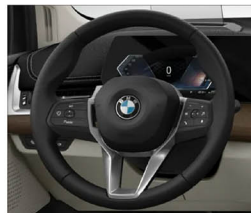
跑車多功能方向盤