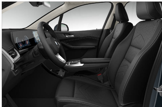
Sensatec 透氣皮質 / 標準座椅 220i Active Tourer