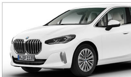
220i Active Tourer Luxury