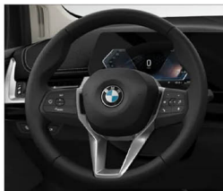
跑車多功能方向盤