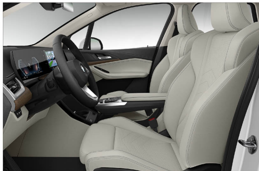
Sensatec 透氣皮質 / 跑車座椅 220i Active Tourer Luxury