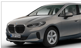
220i Active Tourer